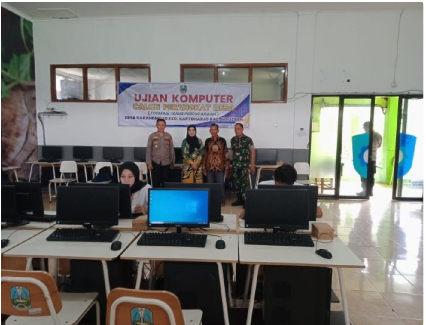
Danramil 0804/08 Barat Hadiri Penjaringan Ujian Praktek Komputer Calon Perangkat Desa Karangmojo

Magetan. – Komandan Koramil (Danramil) Tipe B 0804/08 Barat Kapten Inf